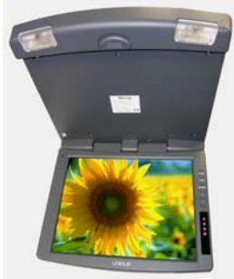
Gris oscuro Dark Grey