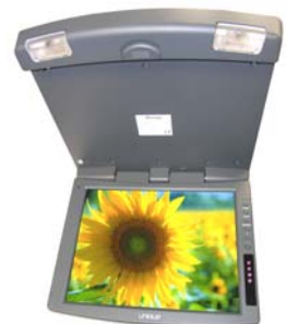
Gris Claro Light Grey